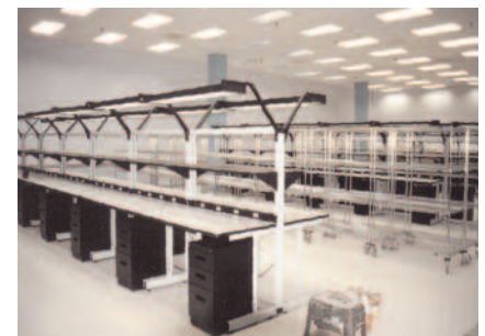
Manufactura en Línea