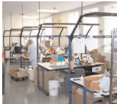
Estaciones de Ensamble