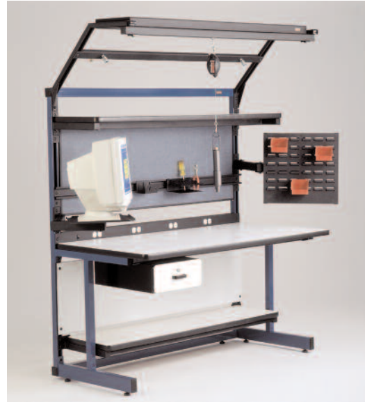
Serie C-Leg con accesorios opcionales.

Utilice la serie C-Leg para incrementar la organización y ergonomía en su fabrica. El diseño modular de la estación le permite agregar y reconfigurar las unidades para ajustarse a las fluctuaciones de producción. La altura de cada unidad es ajustable manualmente para adaptarse a trabajos de pie y sentados. La estructura trasera esta construida con un marco vertical para facilitar el agregar componentes y el ajuste de accesorios.