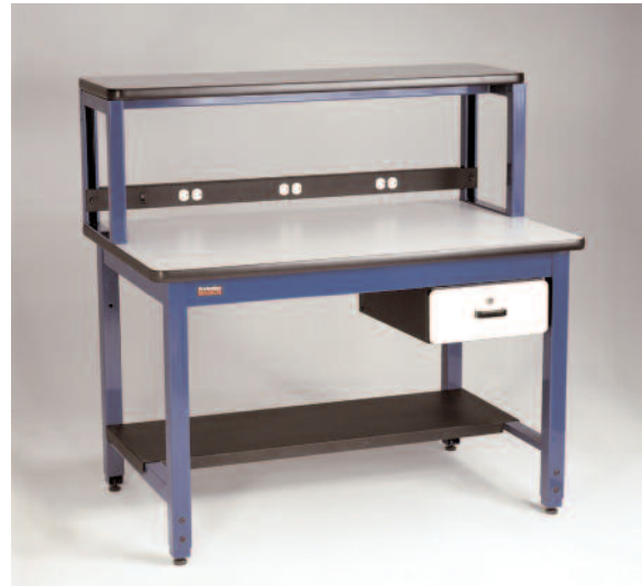
Mesa RTW con repisa ajustable opcional, Riel de poder, Cajón y repisa inferior

Utilice la Mesa RTW como la base de un ambiente de producción eficiente y ergonómico. La mesa RTW la ayudará a equipar sus instalaciones con estaciones de trabajo más productivas y ergonómicas o sólo cubrir su necesidad de mesas de trabajo. Agregue el sistema vertical para añadir accesorios arriba de la superficie de trabajo o una repisa para colocar componentes o equipo.