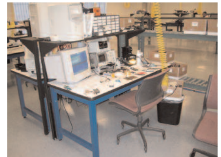
Área de Pruebas e Inspección